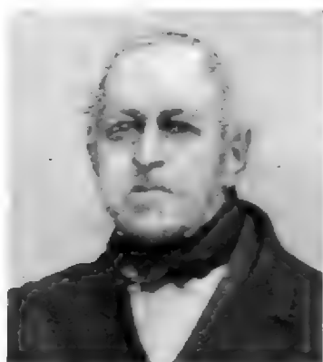
12. J. PH. BOSCH. (1790—1871)